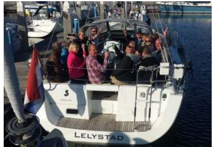
Kan er nog iemand bij?

En inmiddels ook een traditie geworden: proberen om te borrelen met alle deelnemers in één kuip (inclusief meegebrachte huisdieren). Ook die traditie is gehandhaafd. Door alle meegebrachte hapjes, knabbels, toastjes was een avondmaaltijd eigenlijk overbodig