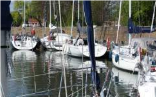
Aan de steiger van de WSV Hoorn

Na de borrel in het restaurant van het verenigingsgebouw zijn we een hapje wezen eten in Hoorn. Allemaal super verzorgd en erg gezellig.