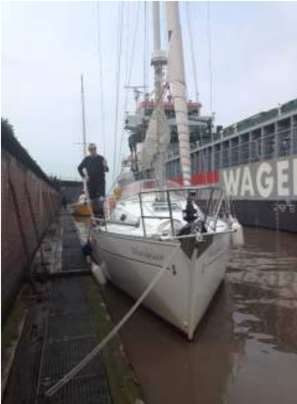
In de sluis van het NOK kanaal

is er van overgebleven en het kanaal heeft weer nieuwe bedrijvigheid gebracht.