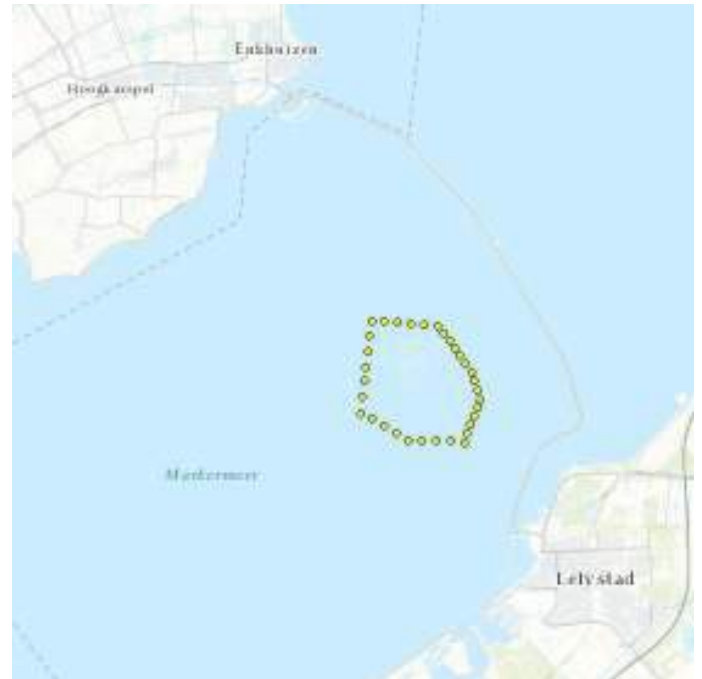
Zo ligt de betonning

Anderen (waaronder wij) probeerden het zeilend. Dat hebben we geweten. Richting Lelystad hebben we zo'n beetje alle windkoersen gehad over zowel bak- als stuurboord. Maar gelukkig trok de wind na het middaguur aan en liepen we tegen 6 uur de haven binnen.