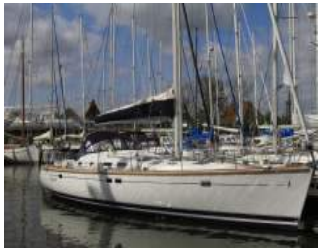
De Beneteau 57CC