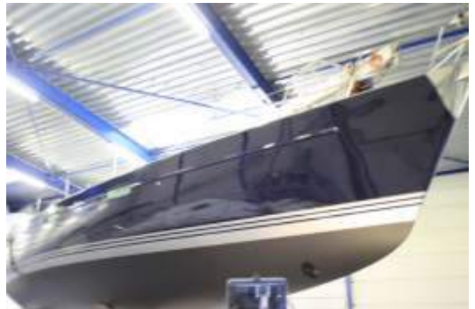
Weer als nieuw

Het verliep allemaal voorspoedig. We vonden wel een flinke schade in de romp onder de waterlijn. De vorige eigenaar, waar ik inmiddels goed contact mee had gekregen, was daar helemaal niet van op de hoogte en het bleek dat er een stempel door de romp was gedrukt. Dit is wellicht in Spanje gebeurd omdat het schip daar met houten palen op de kant heeft gestaan.