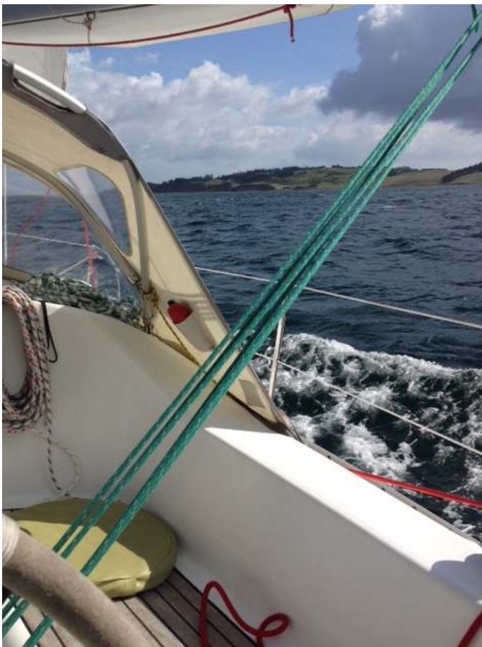
Langs de kust van Jutland

Tot onze grote opluchting deden de Duitsers als echte technische vaklui hun naam eer aan. Binnen 5 minuten hadden ze de juiste diagnose gesteld en 1,5 uur later was het (software)probleem opgelost, inclusief een geslaagde proefvaart door de stormachtige Kieler Forde. Maar intussen waren we met bellen, mailen, wachten en repareren weer een aantal mooie zeildagen kwijtgeraakt. Gelukkig zitten we ruim in onze tijd en, nog belangrijker, konden we nu überhaupt verder. De "Wandelaar" heeft al deze dagen geduldig afgemeerd gelegen in de Olympiahafen, waar alle faciliteiten voor haar bemanning dichtbij waren, zoals een warme bakker, een supermarkt, watersportwinkels, een fraaie omgeving en een heerlijk overdekt zoutwaterzwembad. Bovendien waren de voorbereidingen voor de Kielerwoche in volle gang, een zeilfestijn annex volksfeest waar ongeveer 2 miljoen bezoekers verwacht worden, voldoende reuring in de haven dus.