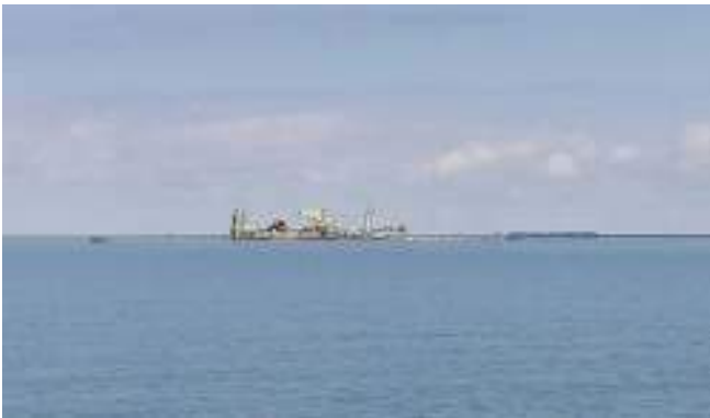
Markerwadden vanaf het water

De volgende dag was er inderdaad geen zuchtje wind. De bestemming was de Bataviahaven in Lelystad Rond een uur of 10 werd er gestart. Een aantal van ons wilde graag de Markerwadden (nog in ontwikkeling) bekijken en begonnen op de motor.