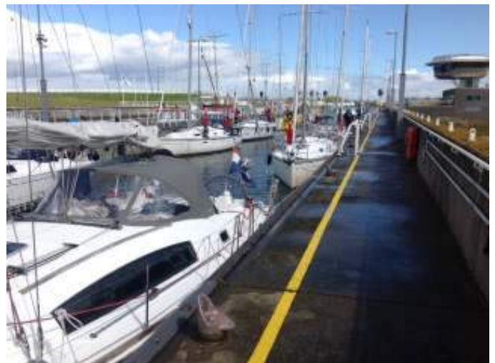
In de sluis bij Enkhuizen

Zaterdag zijn we rond een uur of 11 vertrokken richting Hoorn.