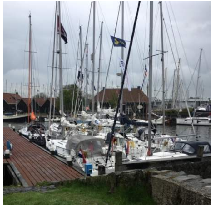
Verzameld in Hindeloopen

Ieder probeerde er maar het beste van te maken, de boten met ondiepe kiel konden over de ondiepte "Nieuwe Zeug" varen, de rest moest een ommetje maken.