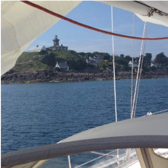
Aanloop Iles Chausey

Zij blijken jarenlang verderop bij ons in de straat te hebben gewoond. Het afmeren en overnachten op de rede van de prachtige archipel Iles Chausey. Hier waren we 20 jaar geleden voor het laatst met de kinderen. Nostalgie ten top.