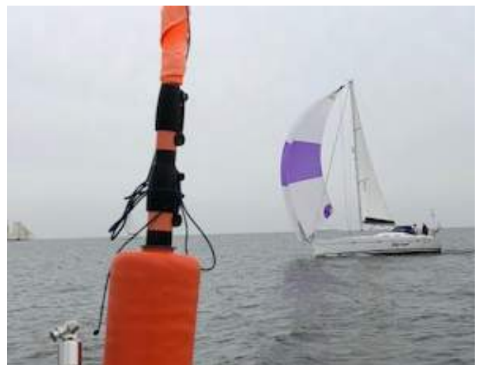
Equipe in sporttenu