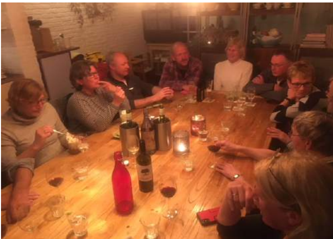
Bij de Italiaan

Bij binnenkomst bleek tot grote schrik van de restauranthouder ons groepje wat gegroeid, daar was niet op gerekend!! Beneteau mensen zijn nogal inschikkelijk en uiteindelijk bleken er ook 14 mensen rond de tafel te passen.